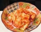
白菜キムチ ¥320 (税込¥352)