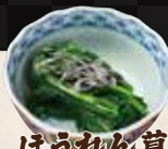
ほうれん草 ナムル ¥320 (税込¥352)