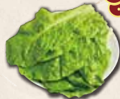
チシャバ ¥290 (税込 ¥319)