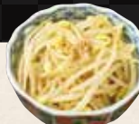
豆もやし ¥320 (税込¥352)