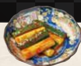
オイキムチ ¥320 (税込¥352)